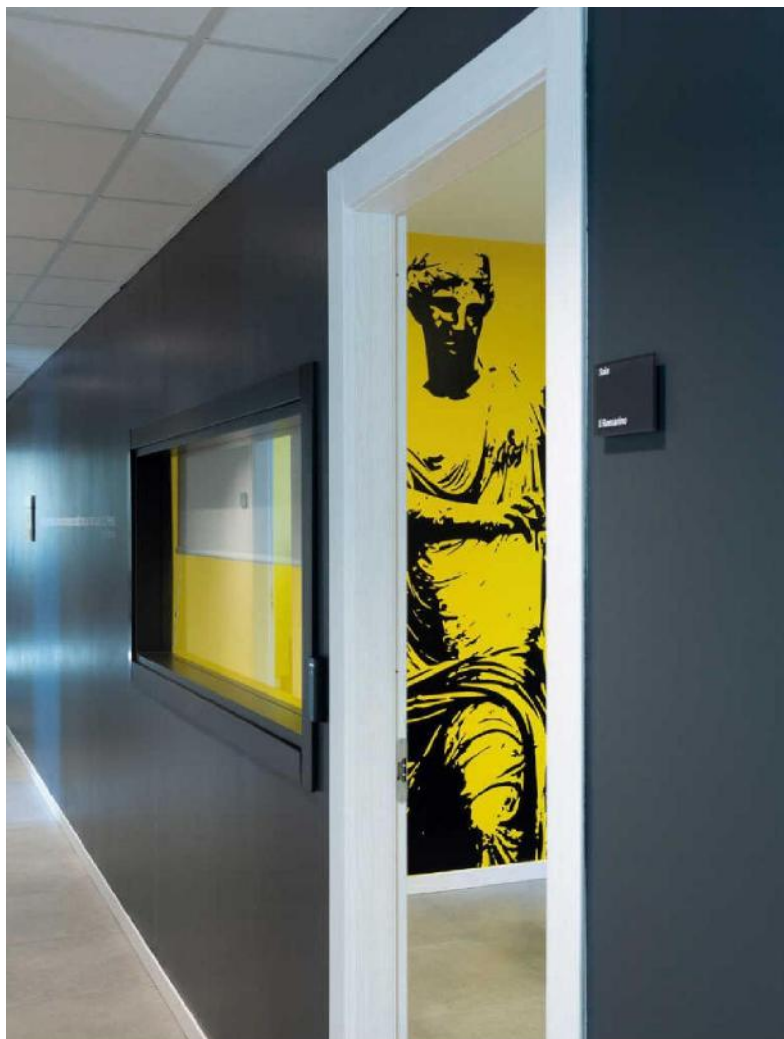
SOPRA E IN BASSO, LA SEDE DI FRATERNITÀ SISTEMI