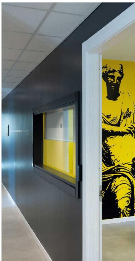
SOPRA E IN BASSO, LA SEDE DI FRATERNITÀ SISTEMI